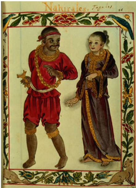
Pre-Colonial Era